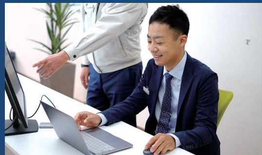
担当/杉本健臣 宅地建物取引士・マンション管理士・管理業務主任者